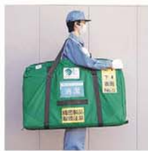
通い袋 特許取得済